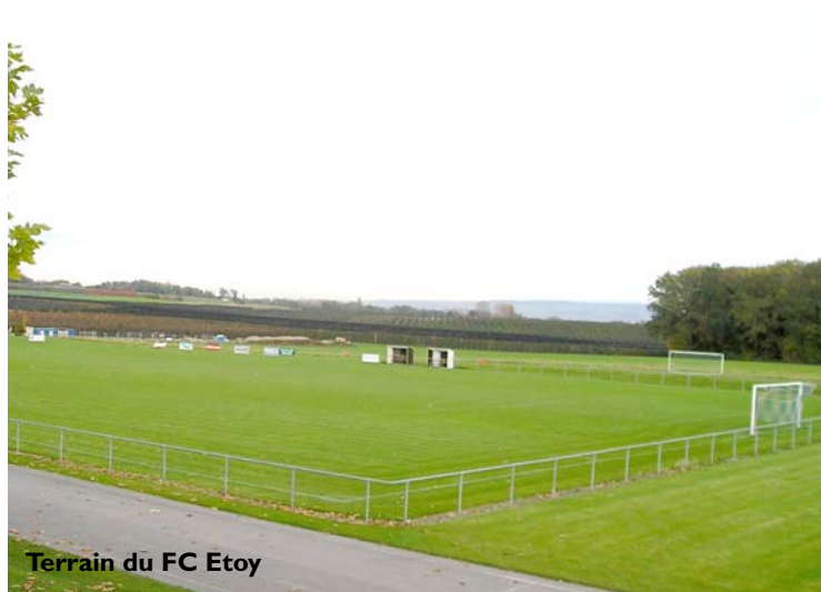
Terrain du FC Etoy