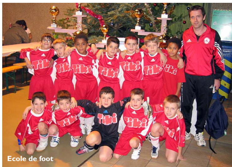
Ecole de foot