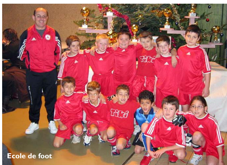
Ecole de foot