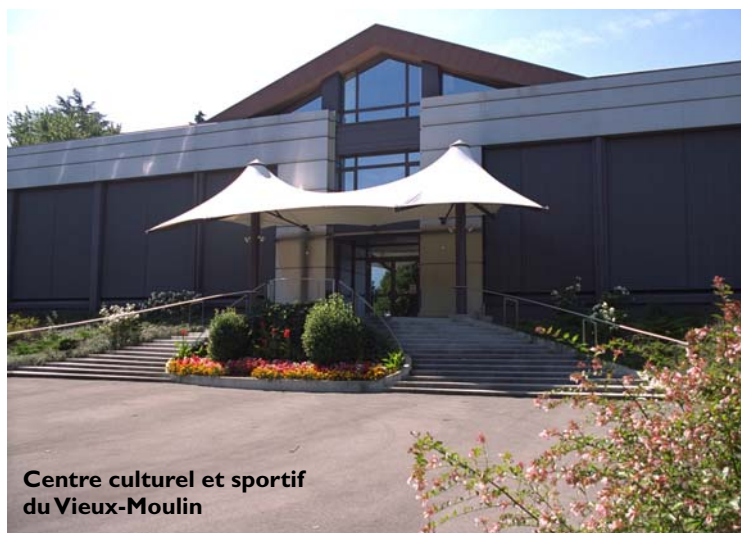
Centre culturel et sportif du Vieux-Moulin