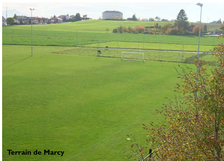
Terrain de Marcy