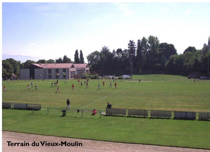
Terrain du Vieux-Moulin