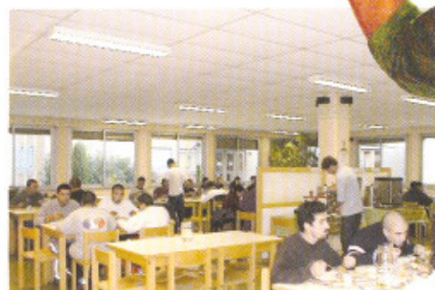
Salle de restaurant. Restaurantsaal. Restaurant room.