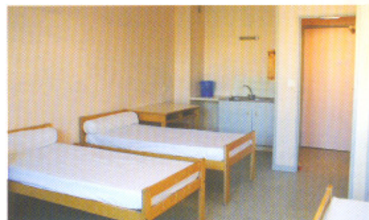
Studio de 35 m 2 avec 4 lits et salle de bains. Einzimmerwohnung 35 m 2 , 4 Betten mit Badezimmer. Studio apartment 35m 2 , 4 beds with bathroom.

Mitten in der Sportanlage befinden sich 12 einfache und saubere Studios für je 4 Personen, eine Cafeteria mit Selbstbedienung für die gezeilte, spezielle Sportlervspflegung, Konferenzraum für Sitzungen und Vorträge zum Thema Sport sowie ein Spielzimmer und ein Aufenthaltsraum mit TV.