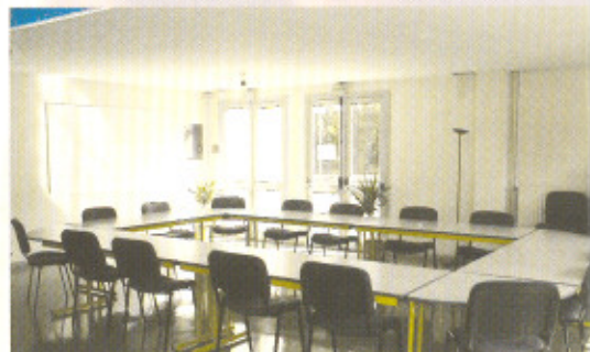
Salle de réunions. Sitzungssaal. Meetingsroom.

Le logis des jeunes, au cœur du complexe sportif, avec 12 studios 4 personnes, au confort simple et propre. Cafétéria, self-service pour les repas sportifs, salle de jeux, salle de télévision et salle de conférences pour les soirées débats organisées sur les thèmes du "sport".